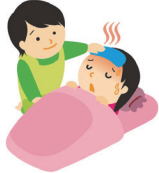
ねつ たか 熱が高い