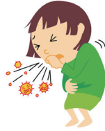
せき で 咳が出る