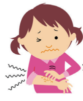
からだ 体がかゆい