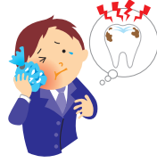
は いた 歯が痛い