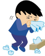
はなみず で 鼻水が出る