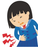
せいりつう 生理痛