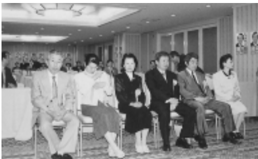
会長表彰受章者の皆さん

表彰式は、さる5月27日の第86回総会終了後、同会場で永年にわたり特に石川県薬剤師会会員のため、また会の発展に多大な尽力並びに協力いただいた方々に対し、会長から表彰状と記念品が贈られその功績が称えられました。