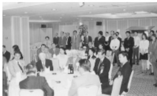
懇 親 会