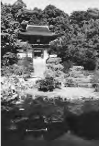
苑池から望む楼門