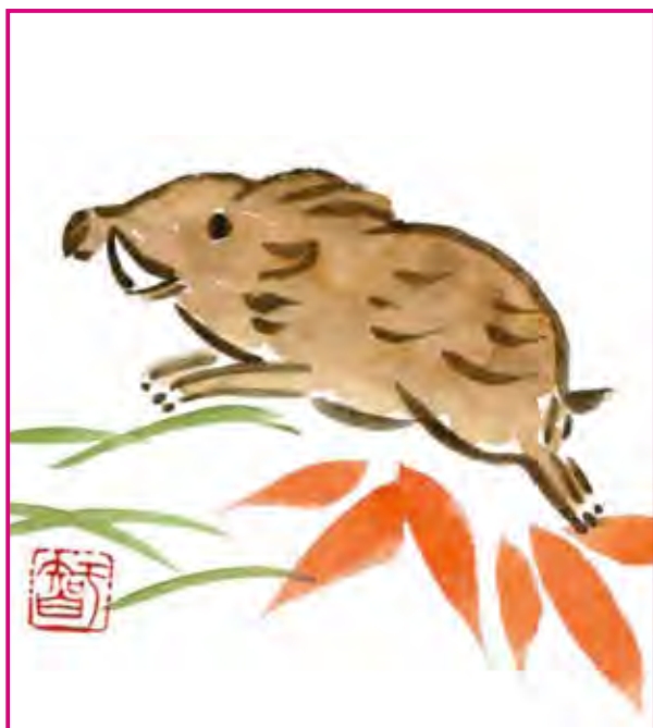
三浦 智子 画